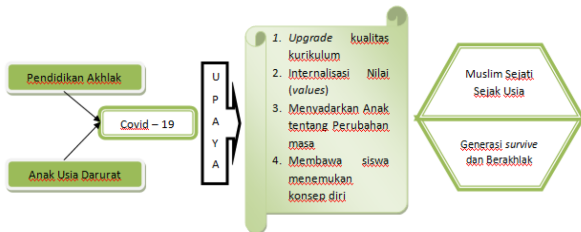
Gambar 1. Skema Alur Riset