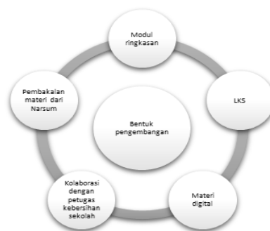
Gambar Bentuk Pengembangan

Selain itu, pendidik menjalin kolaborasi dengan petugas kebersihan sekolah sebagai upaya memperkuat internalisasi nilai-nilai karakter ekologis. Kolaborasi ini tidak hanya mempermudah penerapan program kebersihan, tetapi juga menghadirkan keteladanan langsung bagi peserta didik. Pada kesempatan tertentu, kegiatan pembekalan materi tentang kepedulian terhadap lingkungan bersih berbasis nilai-nilai keagamaan dengan mendatangkan pemateri ahli turut diselenggarakan untuk menegaskan kembali bahwa menjaga kebersihan merupakan bagian dari praktik keagamaan yang harus dihayati dalam kehidupan sehari-hari.