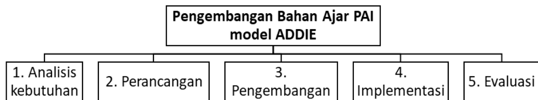
Gambar Proses Pengembangan Bahan Ajar

berbasis eco-lingkungan tidak hanya meningkatkan kompetensi kognitif peserta didik dalam memahami ajaran Islam, tetapi juga membentuk karakter religius, kepedulian ekologis, serta tanggung jawab sosial yang mendukung terwujudnya pembangunan berkelanjutan.