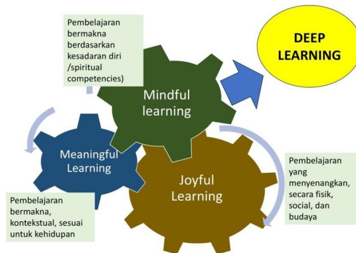
Gambar Peta Konsep Deep Learning